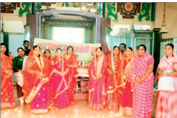
हरिभूमि न्यूज ▶▶ बालोद

नवचेतना संगठन ने बिखेरी भारतीय संस्कृति की छटा